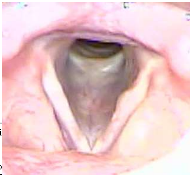
Imagen N° 4: quiste de las cuerdas vocales (laringoscopia directa)

Los nódulos, pólipos, quistes de cuerdas vocales, ver imagen N° 4, se caracterizan por ser lesiones unilaterales con una lesión reactiva contralateral que le brinda cierta simetría, el patrón de cierre de las cuerdas vocales se caracteriza por ser un cierre incompleto, en forma de reloj de arena y en la estroboscopia, una