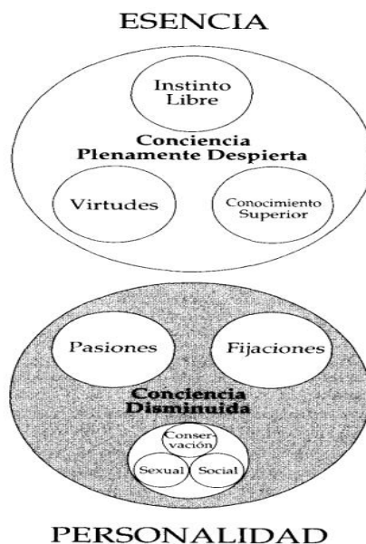
Figura 1 Mapa de la psique

Para el entendimiento de la psicología de los eneatis, desde la figura geométrica del eneagrama, Naranjo (2019) propone el mapa de la psique (figura 1). Este mapa representa la psique con dos centros a los que Naranjo denomina como esencia y personalidad, incluyendo al espacio que hay entre ellos, el cual toma como símbolo de la conciencia misma.