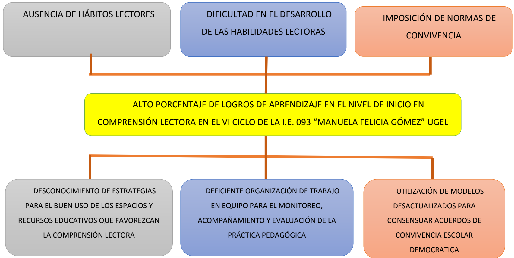
Figura N°2: Árbol de Problemas