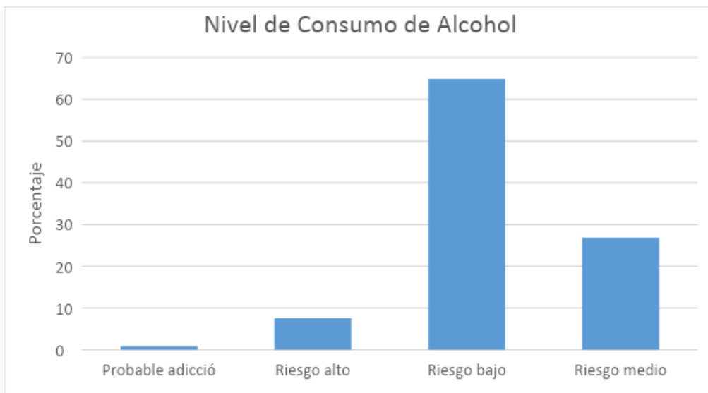
Niveles de Consumo de Alcohol

Nota. El gráfico representa los niveles de consumo de alcohol, así como los porcentajes que se encuentran en cada nivel.