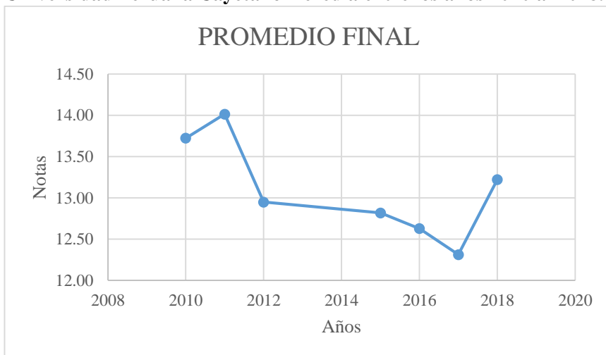
Gráfico N°1. Promedio final en el Curso de Infectología Estomatológica en la Universidad Peruana Cayetano Heredia entre los años 2010 al 2018.

*No se contaron con los datos de los años 2013 y 2014.