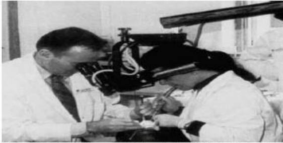
Fig 1. The Dentiscope—the first DOM—in use.