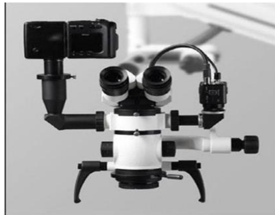
Figura 5: Microscopio adjunto con digitales cámara para la documentación apropiada