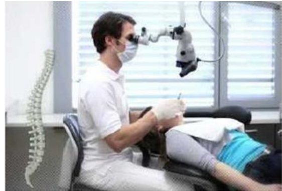
Fig. 4: Improved ergonomics during working with dental operating microscope