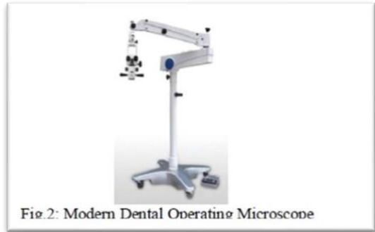
Fig. 2: Modern Dental Operating Microscope