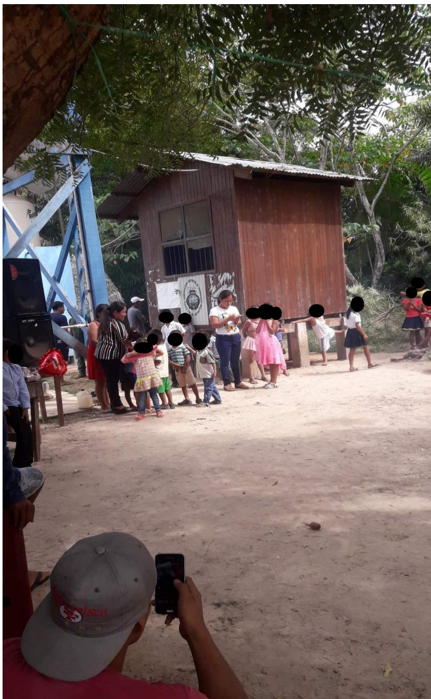
Imagen N°10. Cantando “dedico a mi madre y para todas las madres de Maxkoshoko Jema”

Esta niña canta muy bien, pronunciando el castellano perfectamente sin dificultad. También, en la imagen podemos observar que los niños y niñas de inicial están cantando antes que la niña pase a cantar y los usos de la lengua fueron en la lengua castellano.