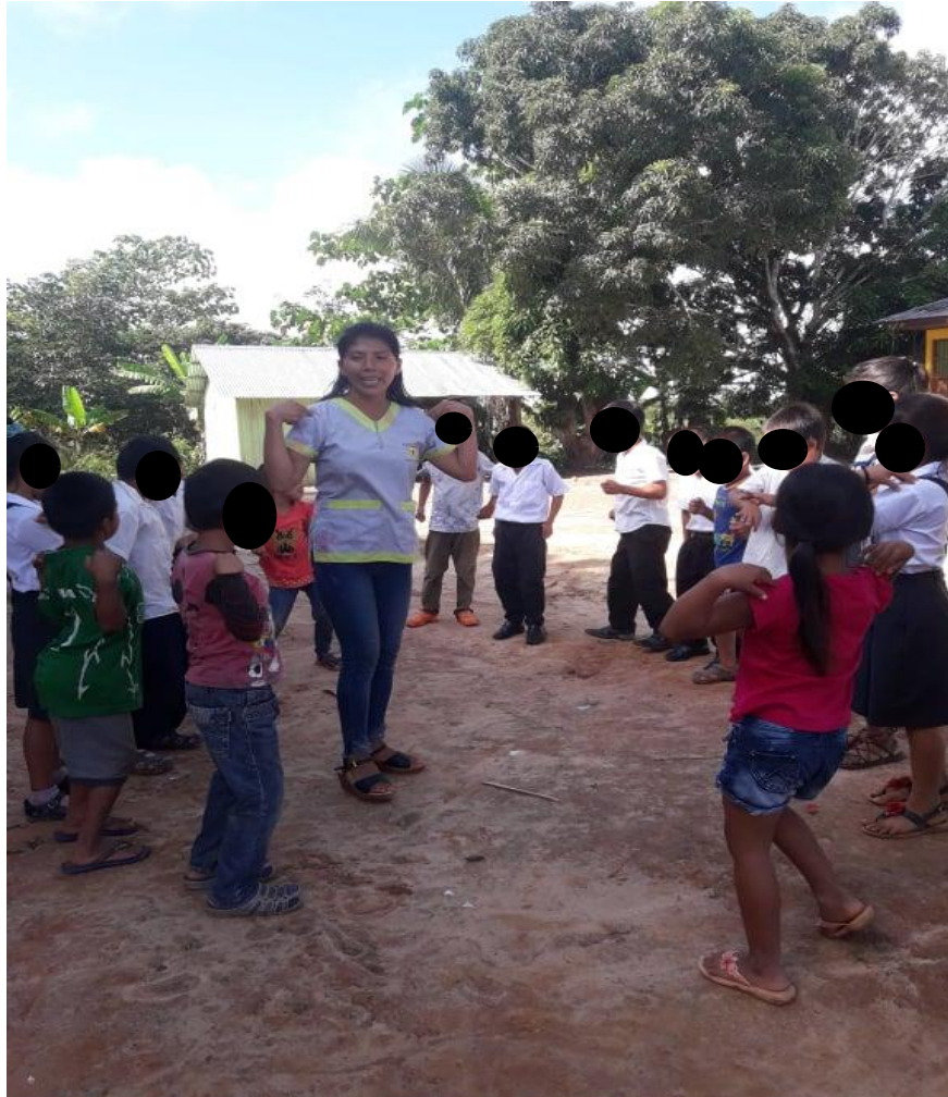
Imagen N°6. Los niños y niñas cantando “baila baila” identificando los hombros, rodillas, cabeza, pies.

En la foto se nota claramente que los niños y niñas cantan haciendo los movimientos de “baila, baila”. En la canción se debe hacer diferentes movimientos tocando del cuerpo, la rodilla, pies, hombros y cabeza. Junto a mi cantan los estudiantes viendo o guiándose. Ellos comprenden el castellano cuando cantan.