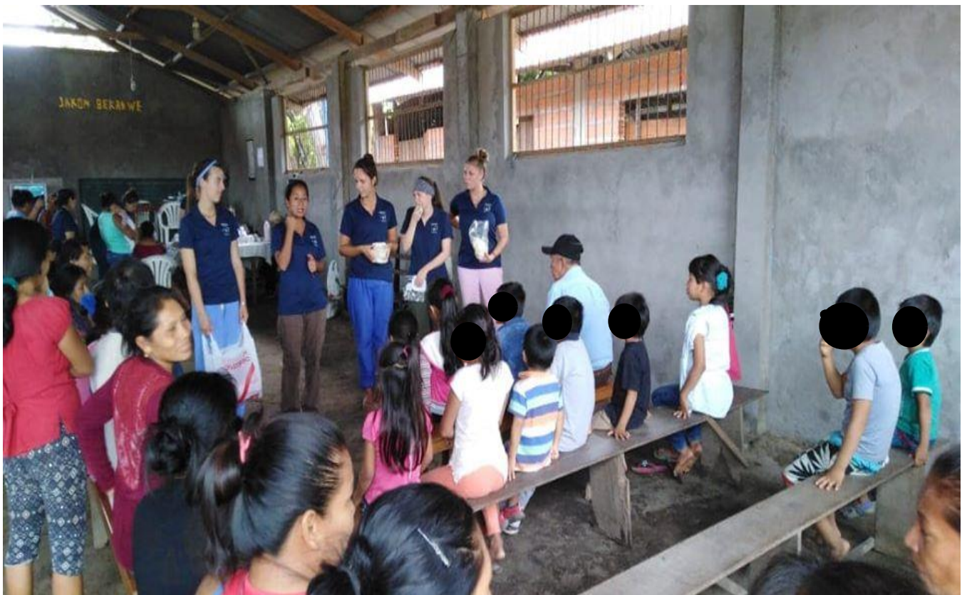
Imagen N° 12. Campaña médica de los extranjeros.

Por ende, los doctores extranjeros al momento de atender a los pacientes tenían al costado a la intérprete. En primer lugar, los médicos se presentaron y al mismo tiempo los niños y niñas también se presentaron; una doctora hizo una dinámica grupal para expresar sus sentimientos, le dijo “pueden expresar con tristeza, alegres, asustados y mostrando sus sentimientos mientras dicen sus nombres”. Ellos cumplían lo que les dijo la doctora. En segundo lugar, las odontólogas explicaban a todos los niños y niñas sobre el cuidado de los dientes en la lengua castellano. Como se muestra en el imagen N° 12