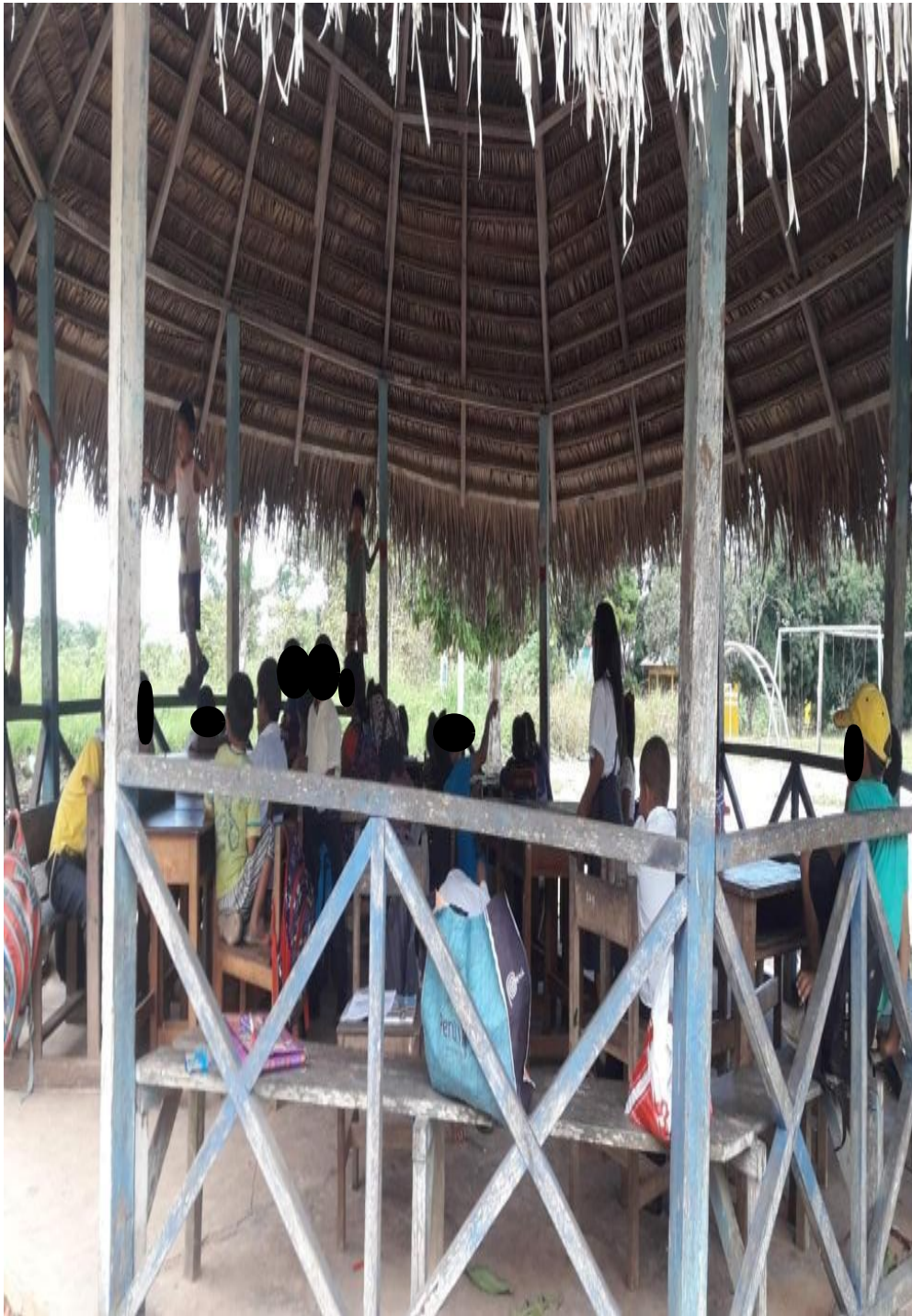
Imagen N° 2. En la maloca jugando a Avatar.

En los juegos, los niños y niñas siempre se van a recoger frutos que hay en la comunidad como la guayaba, mandarina, etc. De igual manera, algunos de los niños y niñas juegan fútbol. Por ejemplo, un niño que pude entrevistar que al momento de jugar ellos dicen: