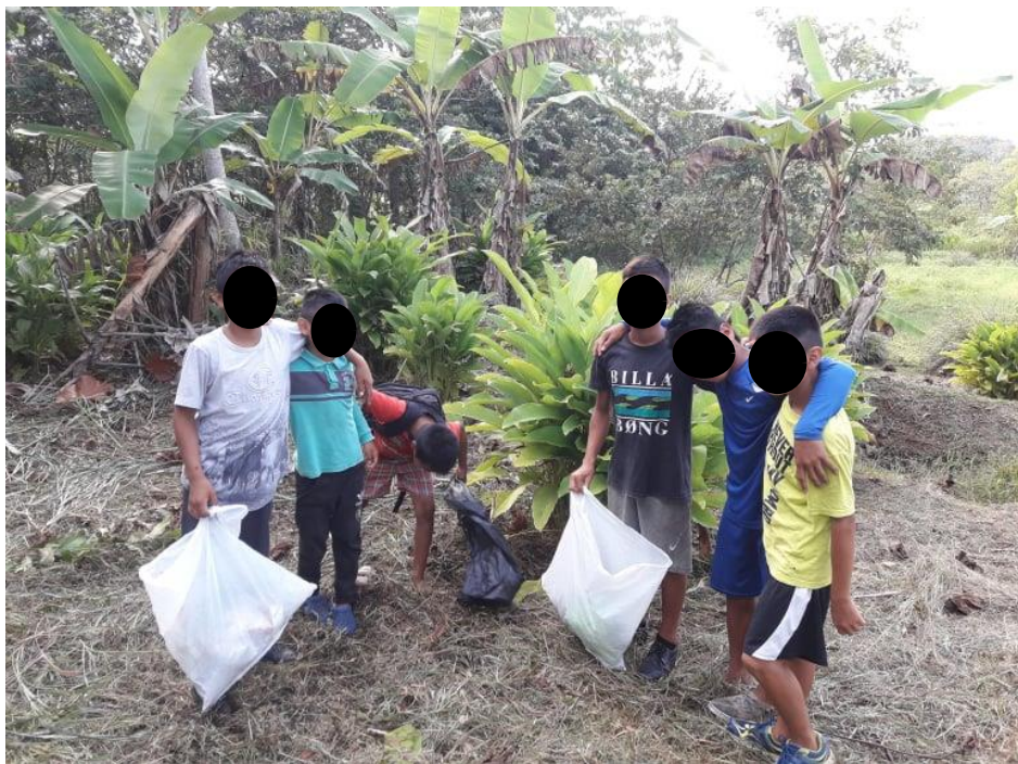
Imagen N° 11. Limpiando mi Escuela.

temprano (5 a.m.) para realizar la faena comunal. Cuando comunicaban a los comuneros los dirigentes utilizaban la lengua shipiba. En segundo lugar, los varones se distribuyen cada calle y empiezan a cultivar con la ayuda de sus machetes, con “weti” (palo) y pala. Por otro lado, las mujeres barren con sus escobas las calles y recogen en costales las hierbas, para quede bien limpio. En tercer lugar, todos, padres e hijos participan con entusiasmo en la faena comunal muy contentos y el pueblo se ve limpio en sus calles, plaza, escuela, etc, ante los ojos de los visitantes y sobre todo para los mismos comuneros. A los niños y niñas más que todo se les mandaba a recoger basura alrededor de la escuela. Como veremos a continuación en la imagen N° 11.