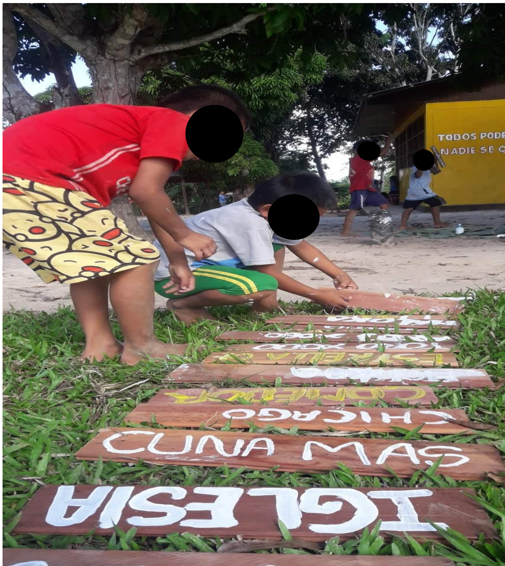
Imagen N° 9. Utilizando la madera para los letrados de la escuela.

En esta sección de fotos estamos viendo cómo han escrito en castellano y en shipibo los niños y niñas el letrado de su comunidad y escuela. En principio habíamos pensado letrar la parte de la escuela. Pero, como ellos pensaron y nos pidieron letrar la comunidad, entonces se pudo ayudar a escribir a los estudiantes. Cada grupo se fue con sus clavos y martillos. En cada momento, ellos mencionan nombres de cada cosa que les parecía importante, sobre todo de la