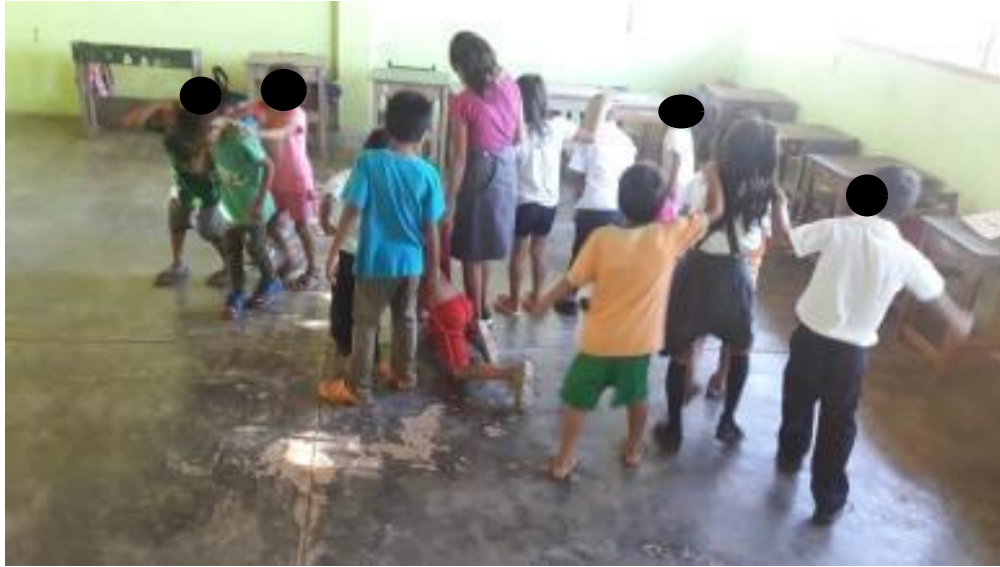
Imagen N°. 3 haciendo movimientos de los diferentes animales.

En esta foto observamos que al momento de jugar con las dinámicas a la hora de castellano hasta podían representar con los movimientos de los animales por cada grupo. Estas dinámicas ayudaban a aquellos estudiantes que no participaban mucho a la hora de clase de L2 al jugar las dinámicas se sintieron en un ambiente afectivo positivo y con menos temor a hacer el uso del castellano.