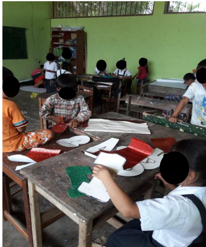
Imagen N°. 5. Trabajo en equipo.

Algunas veces esperaban la tijera para recortar los números, ellos también hablaban sobre que se fueron a la ciudad a hacer compras con sus papás. Es decir cuando realizaban este tipo de trabajos, dialogaban en la lengua shipibo y mezclando castellano en algunas oraciones o palabras; contaban lo que le pasó ayer o la semana pasada.