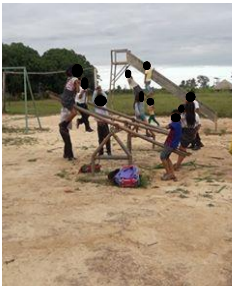
Imagen N° 7. Jugando en los columpios (campo).

En el campo los estudiantes juegan diferentes juegos tales como por ejemplo el fútbol, el cocodrilo, quien chapa primero, Avatar, etc. Aquí los niños y niñas usan el castellano y el shipibo al momento de jugar. Como observamos en la siguiente imagen.