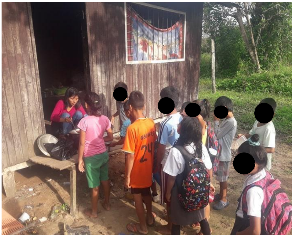
Imagen N° 1. Recojo del desayuno escolar (Proyecto Kaliwarma)

Como podemos observar en la Imagen N° 1, una señora sirve la leche a cada niño y niña; al costado de la puerta un niño habla con ella en castellano para preguntarle si la leche estaba muy caliente. La señora le responde en shipibo, porque conoce que el niño comprende ambas lenguas, tanto castellano como shipibo.