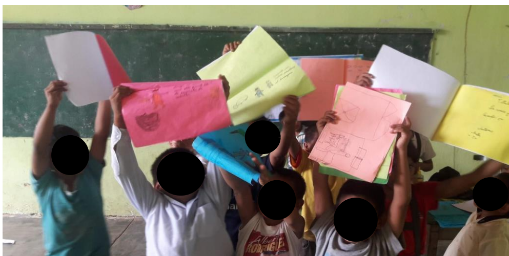
Imagen N° 2. Mi libro cartonero en castellano.

Definitivamente los niños y niñas realizaron un trabajo especial para ellos, aunque la mayoría todavía no sabían leer en castellano y shipibo todos los días llegaban al aula y se iban al sector de la lectura donde estaban sus libros colgados con una soga a ver, observar los libros. Esto les gustaba y veían sus nombres y se sentían muy felices. Como demostraremos en la Imagen no. 2 abajo.