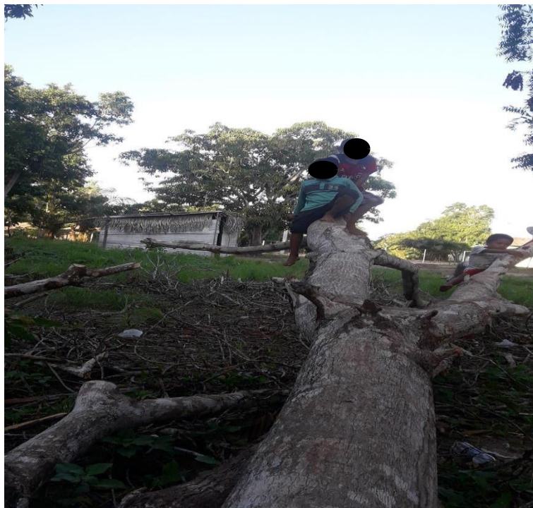
Imagen N°1 jugando a Avatar

a ellos les gustaba jugar imitando a la película. A continuación, observaremos algunas imágenes del juego Avatar.