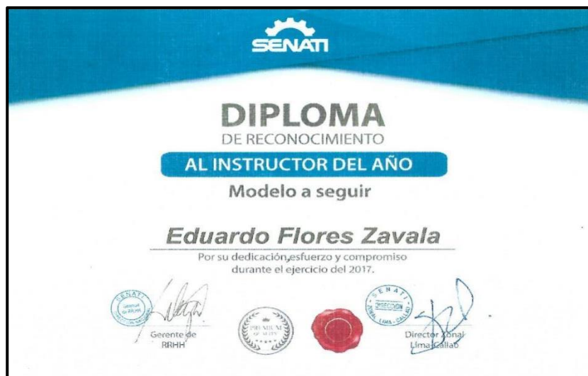
Figura 6 Diploma de reconocimiento al Instructor del año 2017. Modelo a seguir. Otorgado por la dirección zonal Lima-Callao del SENATI CENTRAL.

Por haber realizado una mejora para la Institución en el control de desechos sólidos del CFP Senati San Juan de Lurigancho (DIPLOMA DE RECONOCIMIENTO AL INSTRUCTOR DEL AÑO MODELO A SEGUIR).