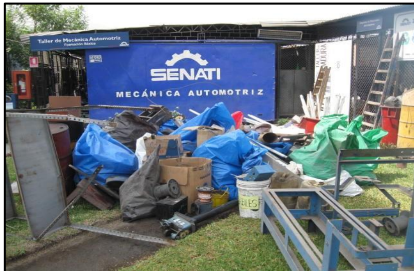
Figura 1 los residuos que se generaban en los talleres eran depositados en los parques y jardines del SENATI SJL.

El lugar de los desechos sólidos, se encontraba amontonado de residuos peligrosos y tóxicos, estos representaban un peligro y riesgo para la salud de las personas, emanaba olores pestilentes y gases tóxicos; además, servía de criaderos de roedores e insectos.