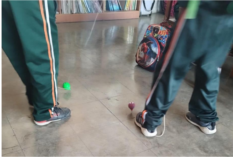
Figura 1: Juego tradicional el “trompo”.

Nota: Estudiantes de cuarto grado de primaria jugando el juego tradicional del “trompo” en el recreo.