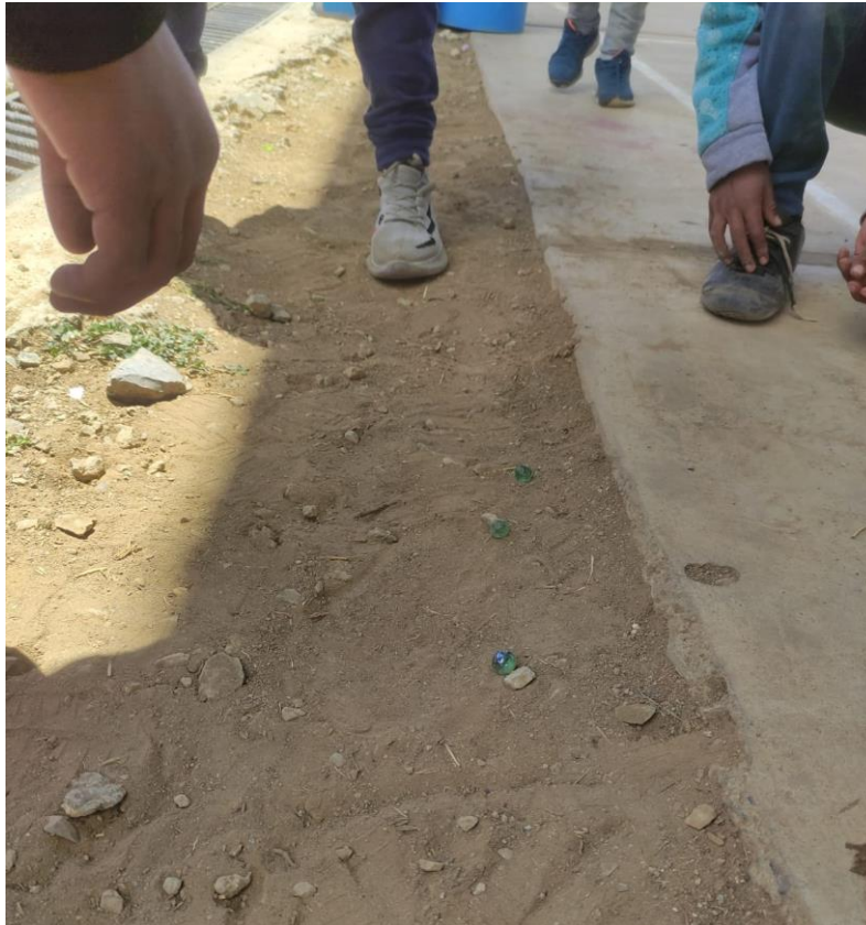
Figura 2: Juego tradicional las “canicas”.

Nota: Estudiantes de quinto grado de primaria jugando a las “canicas” en la hora del recreo.