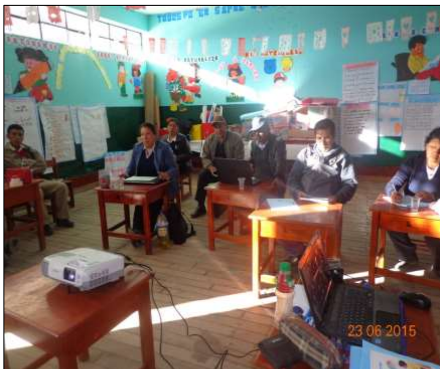
DOCENTES ENTUSIASTAS PARTICIPAN DEL MICROTALLER REALIZADO POR LA ACOMPAÑANTE