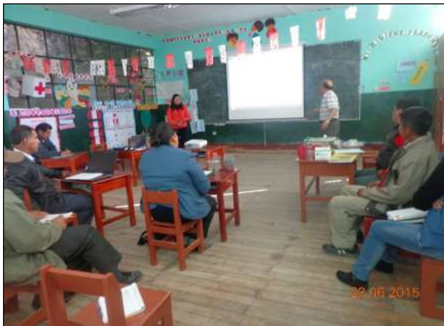
ACOMPAÑANTE EN UN MICROTALLER SOBRE ESTRATEGIAS PARA LA PRODUCCIÓN DE TEXTOS