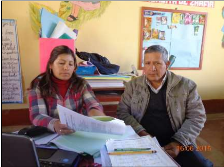
ASEORANDO AL DOCENTE DE AULA DE LA II.EE N° 22097 DEL ANEXO DE PICHUTA