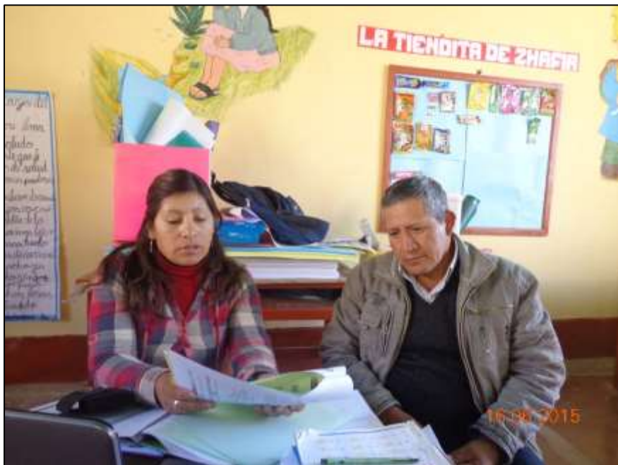
ESTRATEGIAS PARA LA PRODUCCIÓN DE TEXTOS NARRATIVOS