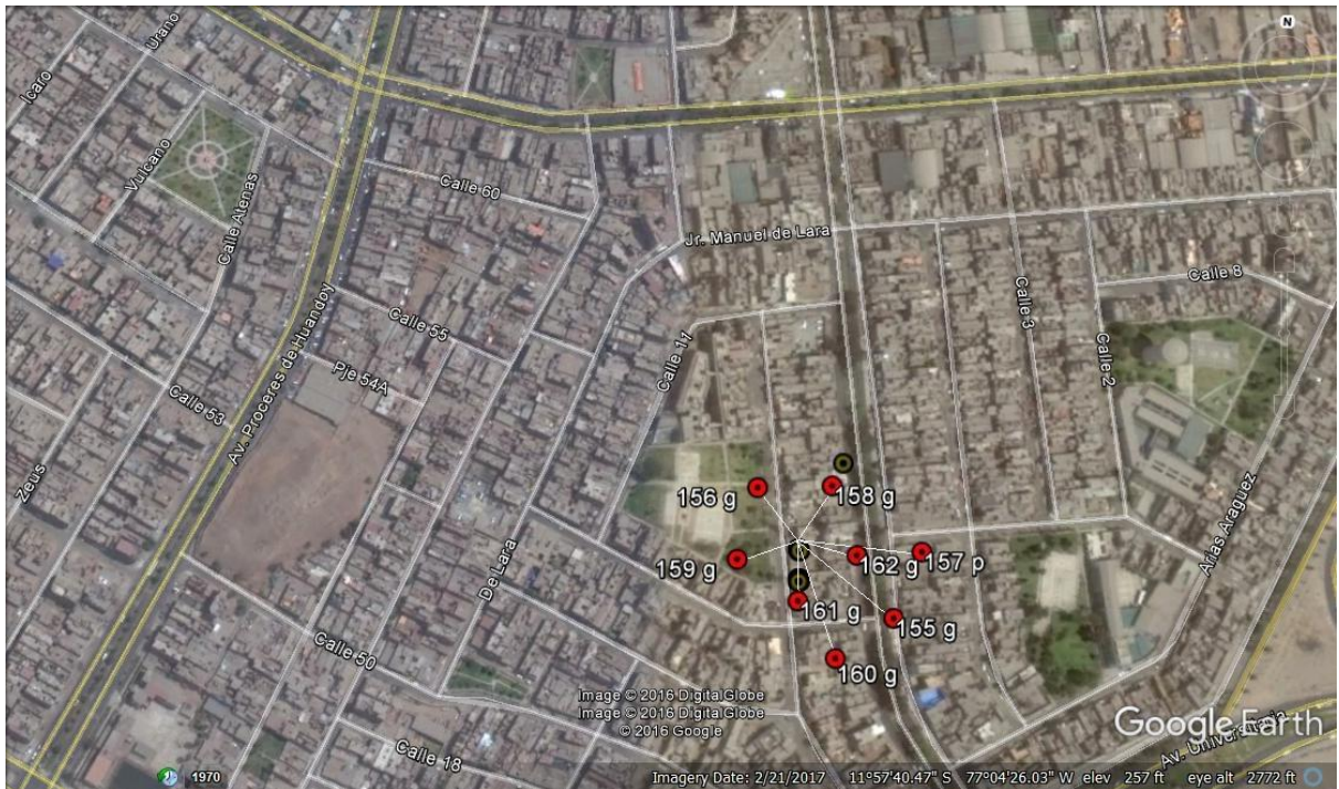
Figura 5. Domicilio con ocho mascotas esterilizadas ubicado a 2,80 km de la Clínica Veterinaria Municipal de Los Olivos.