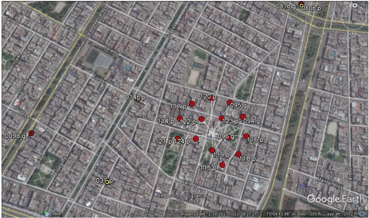
Figura 4. Domicilio con catorce mascotas esterilizadas ubicado a 4,36 km de la Clínica Veterinaria Municipal de Los Olivos.