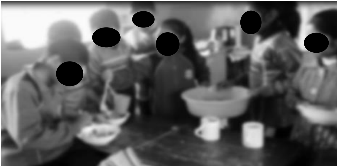
Imagen N°2: Trabajo colaborativo en la preparación de la ensalada de frutas (captura de un video)

En la imagen se muestra un trabajo colaborativo, alguien que reparte la ensalada con la cuchara, alguien que sostiene el recipiente de ensaladas y alguien que acompañara para asegurarse de que alcance para todos y todas.