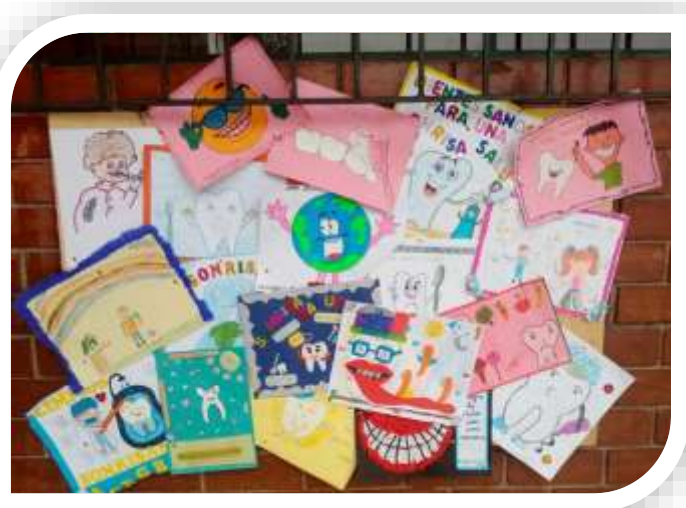
Dibujos de los niños con el tema: Cuidado de la Salud Oral.