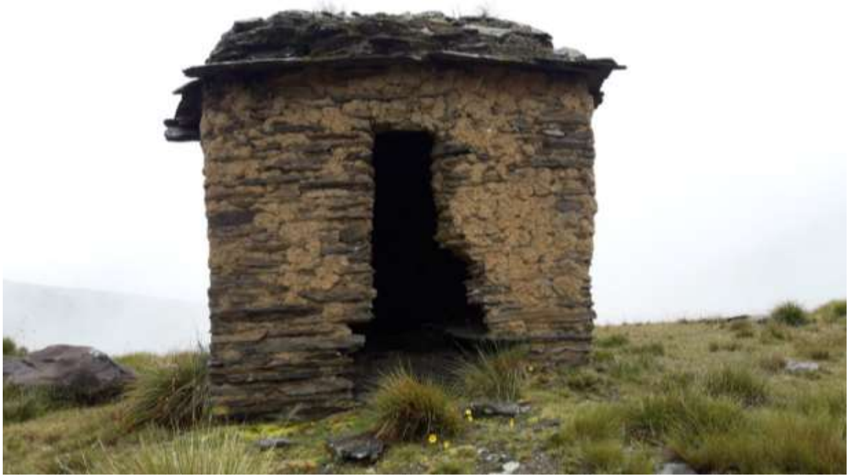
Fotografía 4: Chullpa de Wat'a Marka en dirección a la puesta del sol.