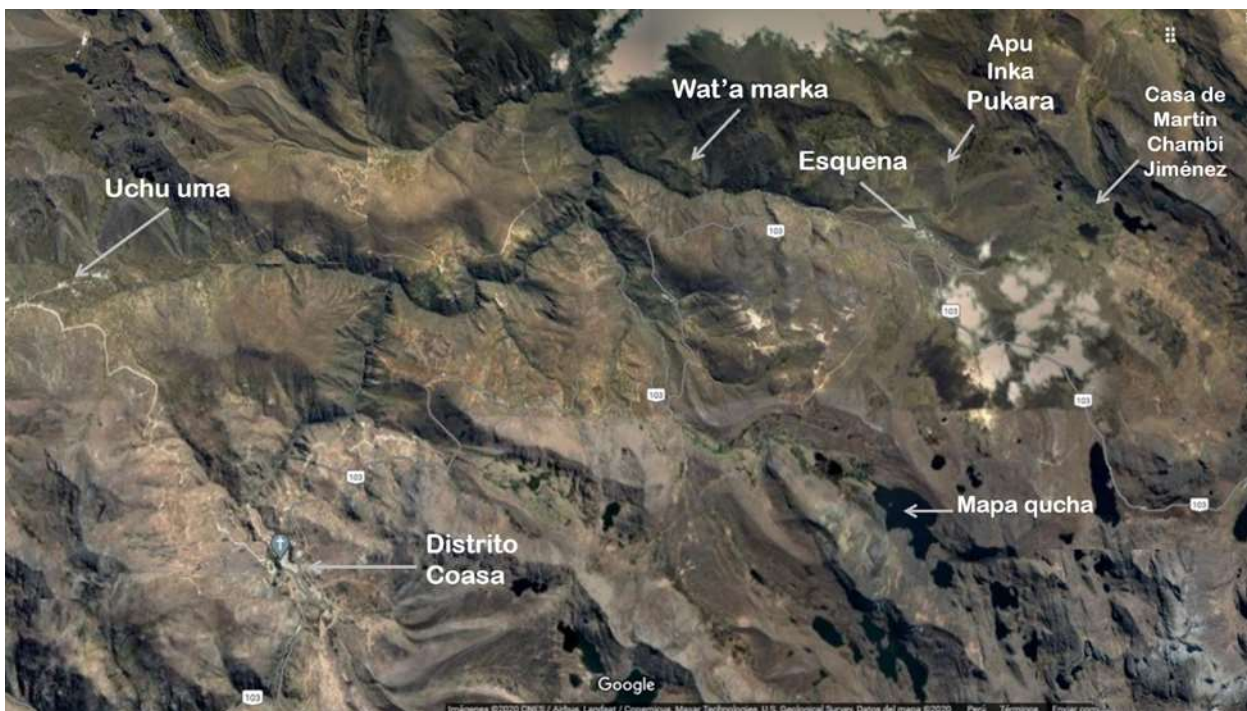
Fotografía 1: Comunidad de Esquena visto desde el espacio (Google Maps).

La comunidad de Esquena tiene como lenguas oficiales el castellano y el quechua; de manera que, las personas de tercera edad tienen como L1 el quechua; mientras que, las personas más jóvenes son bilingües y tienen como L1 el quechua y L2 el castellano, ya sea mujeres o varones. Los niños y niñas de los primeros grados tienen como lengua materna el castellano. Dicho de otra manera, mientras van creciendo aprenden el quechua, ya que en el nivel secundario hablan con mayor familiaridad el quechua. A nuestra manera de ver, la comunidad enseña el quechua en su cotidianidad siendo esta la lengua con la que más se comunican.