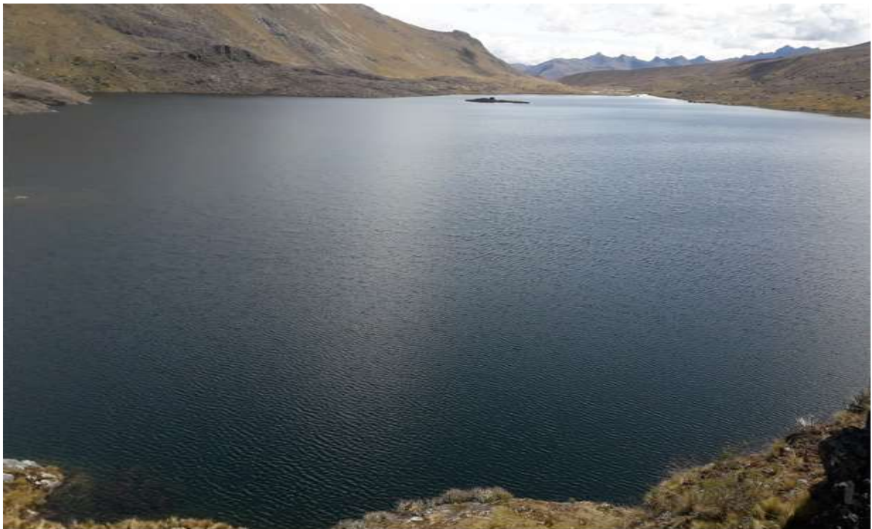
Fotografía 5: Mapa Qucha .