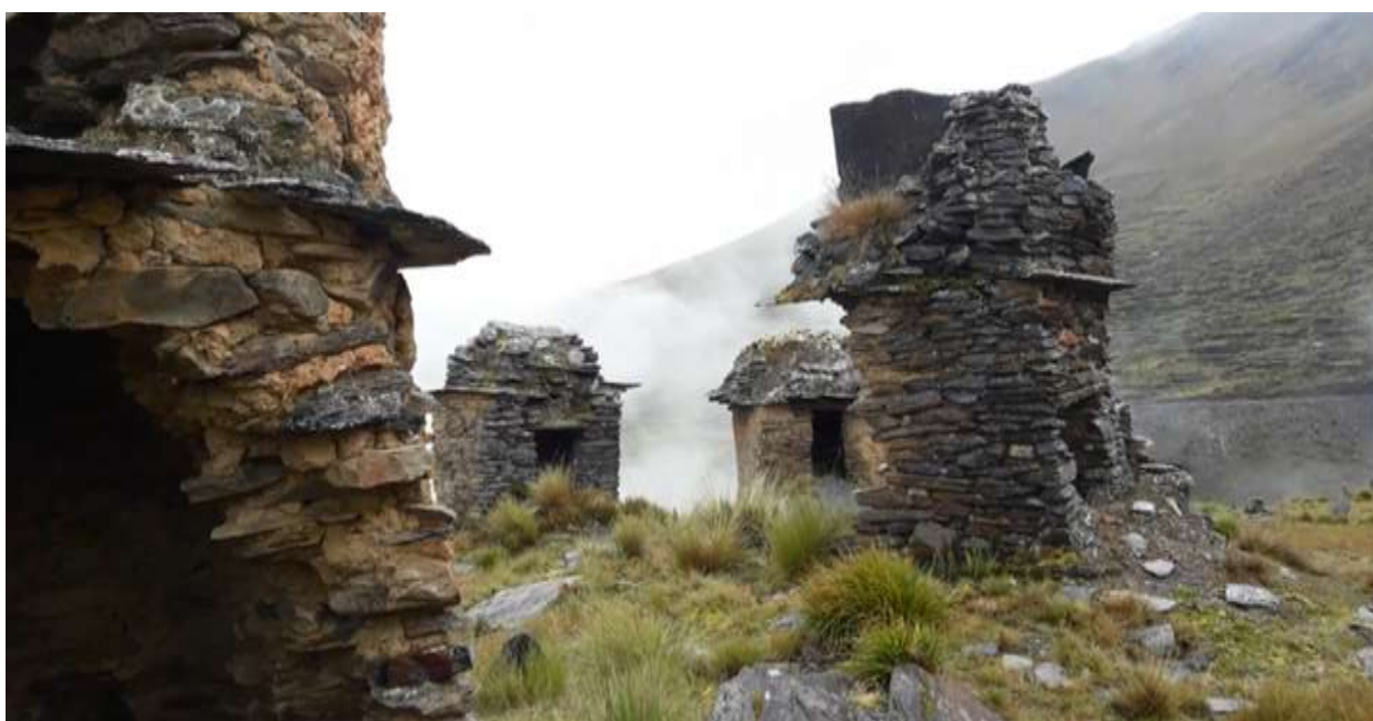
Fotografía 3: Chullpas de Wat'a Marka.