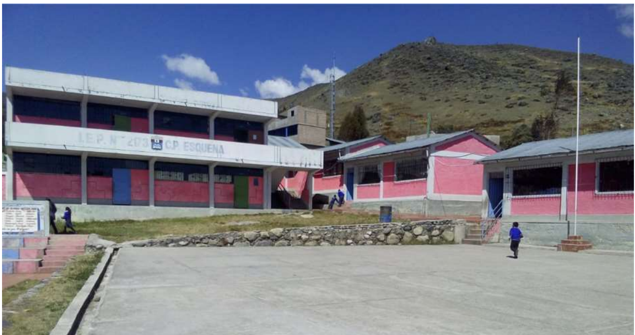
Fotografía 6: IEP N° 72173 Esquena.

La Institución Educativa Primaria cuenta con una infraestructura adecuada para la enseñanza – aprendizaje de los niños y niñas; ya que está construido con material concreto, además las puertas son de madera y algunos de metal, el patio es de cemento y su área verde es de pasto natural.