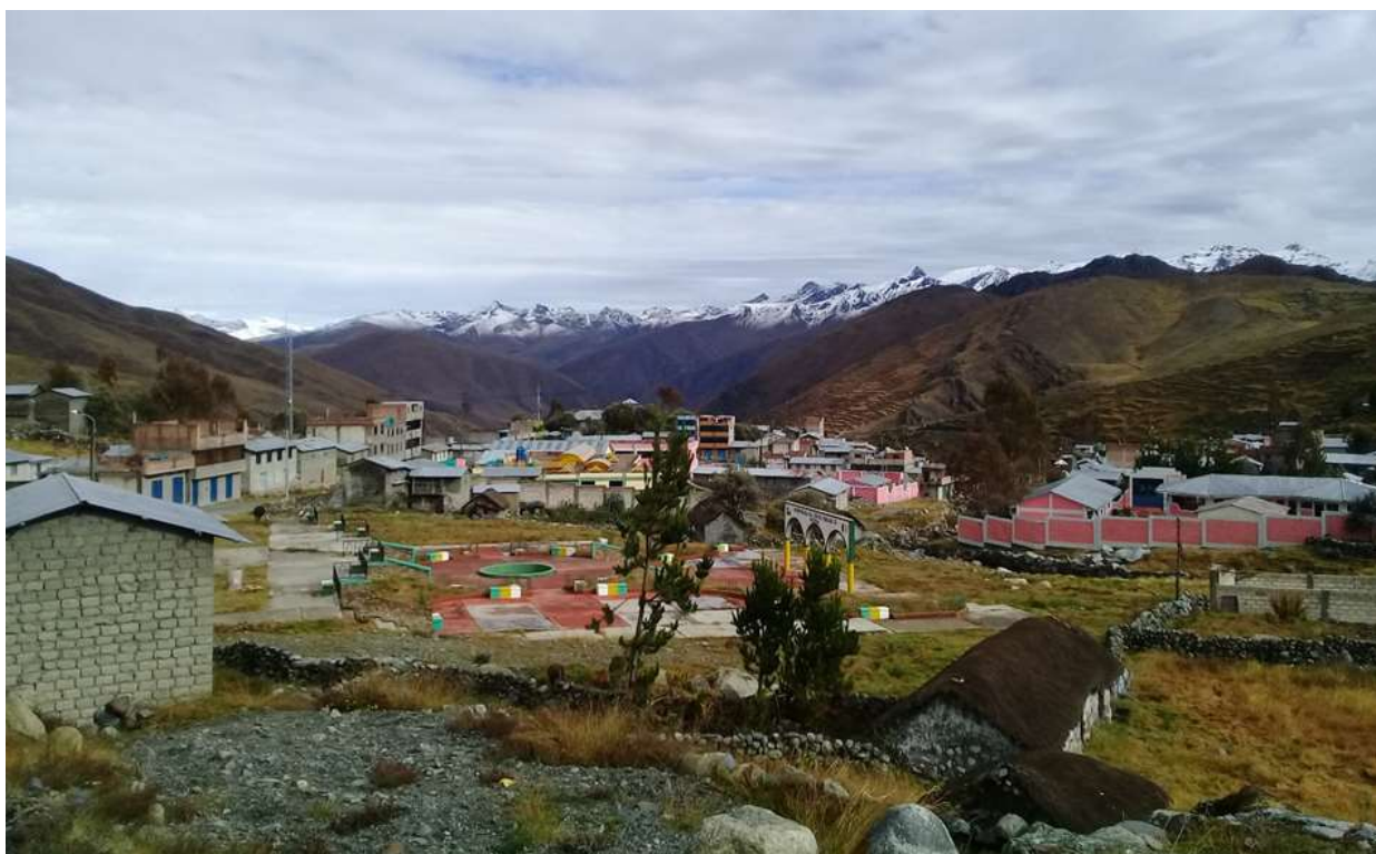
Fotografía 2: Comunidad Esquena.