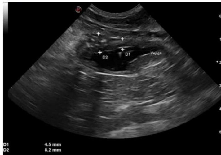
Imagen 6. Ecografía control, engrosamiento de la pared vesical sin presencia de litos caso clínico 1