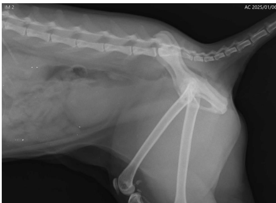
Imagen 9. Placa radiográfica control de caso clínico 2

Para el tercer día se bajó la frecuencia de la metadona y se retiró orina mediante la sonda sin embargo también filtró orina por los laterales de la sonda debido a que el paciente se posicionaba a orinar. El cuarto día la apariencia de la orina fue amarilla clara, se continuó bajando la frecuencia de la metadona, además se programó el retiro de la sonda urinaria para el siguiente día.