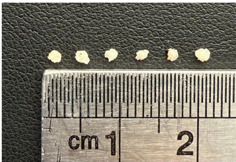
Imagen 11. Urolitos retirados de paciente del caso clínico 3

Para el siguiente día, previo al procedimiento, se realizó un análisis mediante el sistema EPOC donde se evidenció anemia moderada, hipokalemia, valores por debajo del rango de BUN y creatinina, se realizó la suplementación de cloruro de potasio endovenoso (Cuadro 7). La cirugía se llevó a cabo sin complicaciones y se extrajeron 6 urolitos de similar tamaño (Imagen 11), el manejo de dolor posterior a la cirugía se realizó con metadona a 0,2 mg/kg.