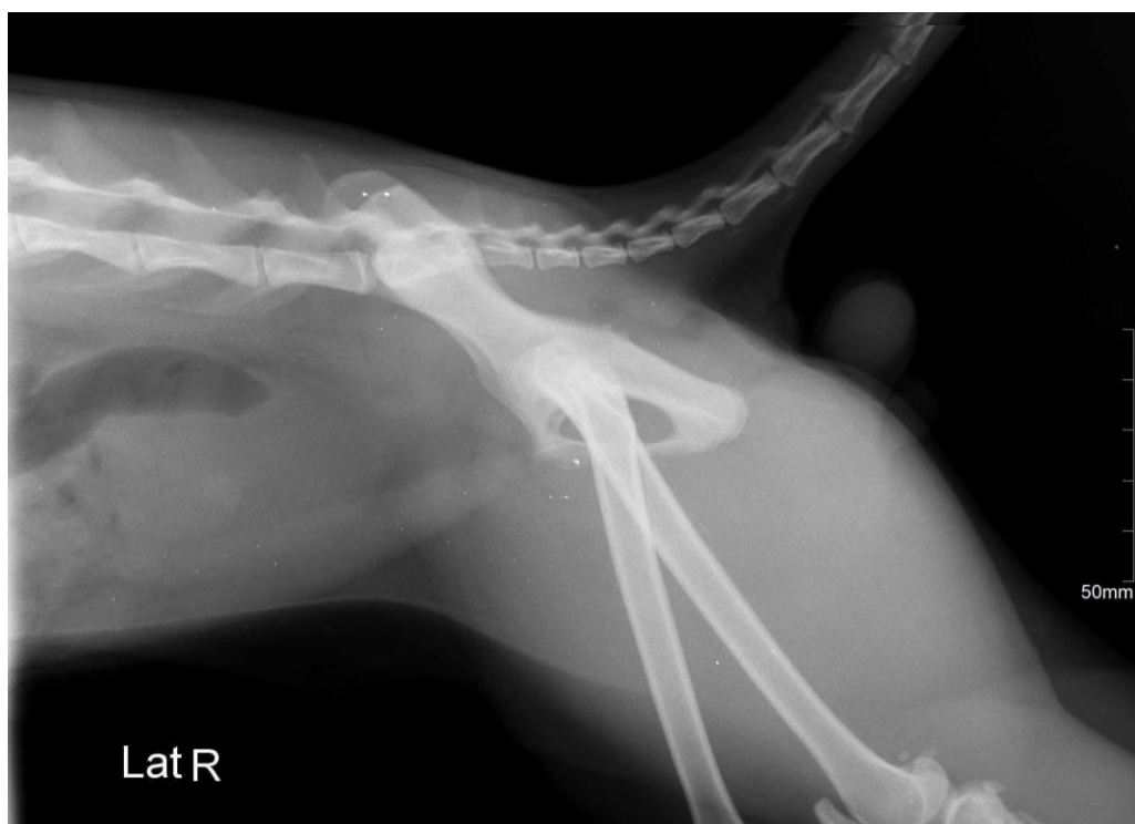
Imagen 7. Placa radiográfica donde se evidencia urolito en vejiga de caso clínico 2