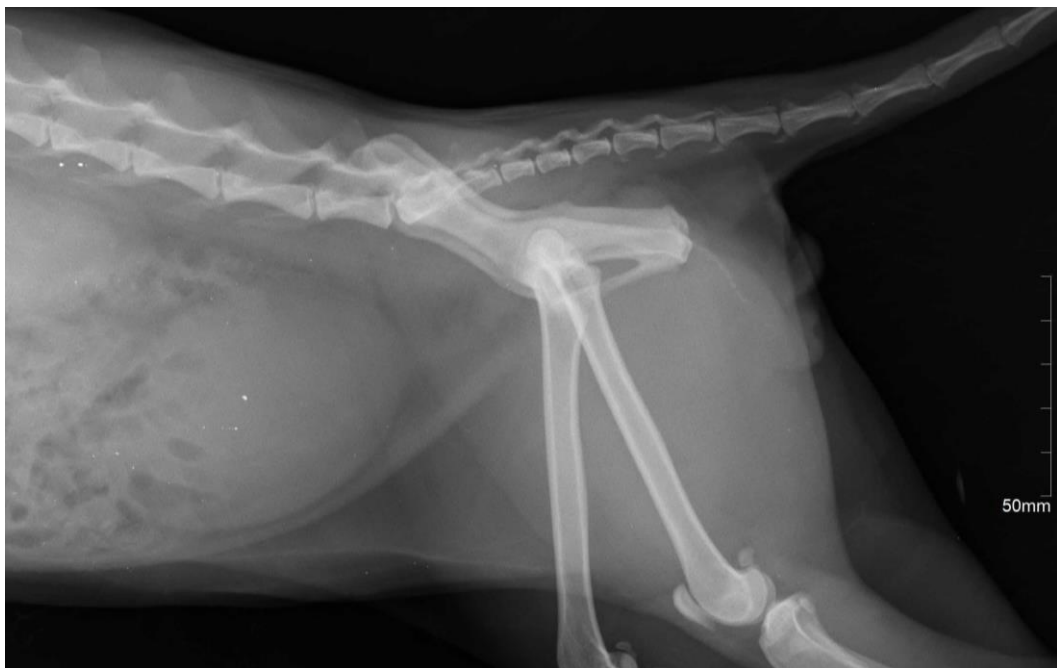
Imagen 10. Placa radiográfica de caso clínico 3

Como manejo inicial se colocó una vía de acceso venoso con catéter endovenoso 22 G x 1” sin fluido continuo, presentó alteraciones en la bioquímica sanguínea, incluyendo elevación leve de BUN, creatinina en el límite superior, hiperfosfatemia, y anemia leve (Cuadro 7). Se realizó el sondaje urinario y se retiró 70 ml de orina turbia y maloliente. Posteriormente, se mantuvo con fluidoterapia continua para controlar la hiperdiuresis y evitar la deshidratación del paciente, la producción de orina fue de 4.5 a 7.7 ml/kg/hr. Se mantuvo con infusión de fentanilo a 3 ug/kg/hr para manejo de dolor (Cuadro 9). Se programó la cirugía de PCCL para el día siguiente, esperando que los valores renales se estabilizarán y el paciente pudiera iniciar tratamiento con el antibiótico específico.