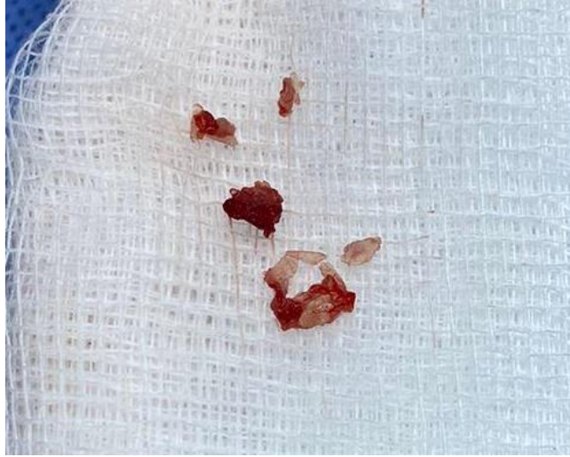
Imagen 8. Urolito y material celular retirado de paciente del caso clínico 2

El séptimo día se realizó una reevaluación mediante el sistema EPOC (Cuadro 4), en el cual se evidenció disminución del hematocrito y hemoglobina, regularización de los marcadores BUN y creatinina, al igual que el potasio. Paciente orinó sin dificultad, pero continuó presentando hematuria.