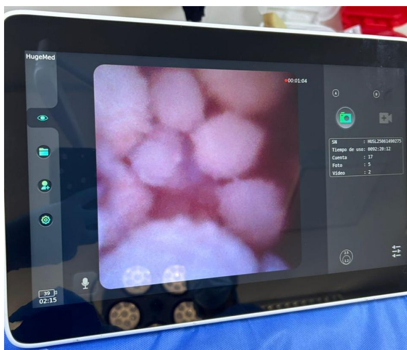
Imagen 2. Visualización de urolitos mediante uroendoscopio durante procedimiento de cistolitotomía percutánea en felino en la Clínica Veterinaria Gatuario.