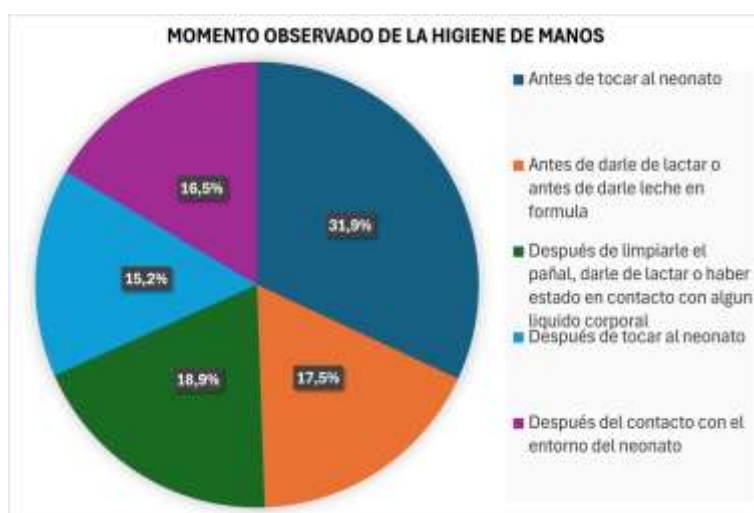
Tabla 7. Cumplimiento de higiene de manos según momento observado